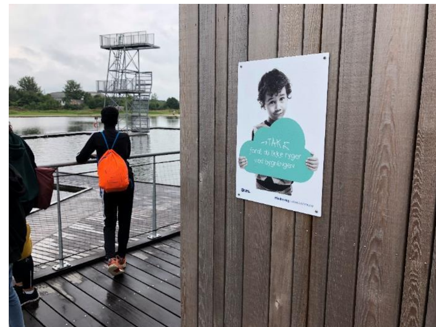
I stedet for at vise et skilt med 'rygning forbudt' vises et skilt, hvor der fx står "Tak fordi du ikke ryger her"

Alle vil ikke følge henstillingerne, men mange vil. Det er vigtigt at fokusere på