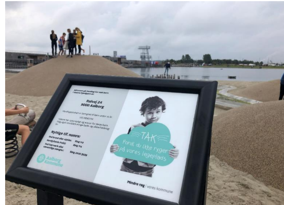
Skiltning ved Vestre Fjordpark i Aalborg Kommune