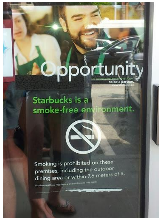
indgang til Starbucks, Vancouver

"We take seriously our responsibility to provide all customers a safe, healthy environment that is consistent across our company-owned stores. We sincerely thank all customers for their support and cooperation." (A Starbucks spokesperson) –