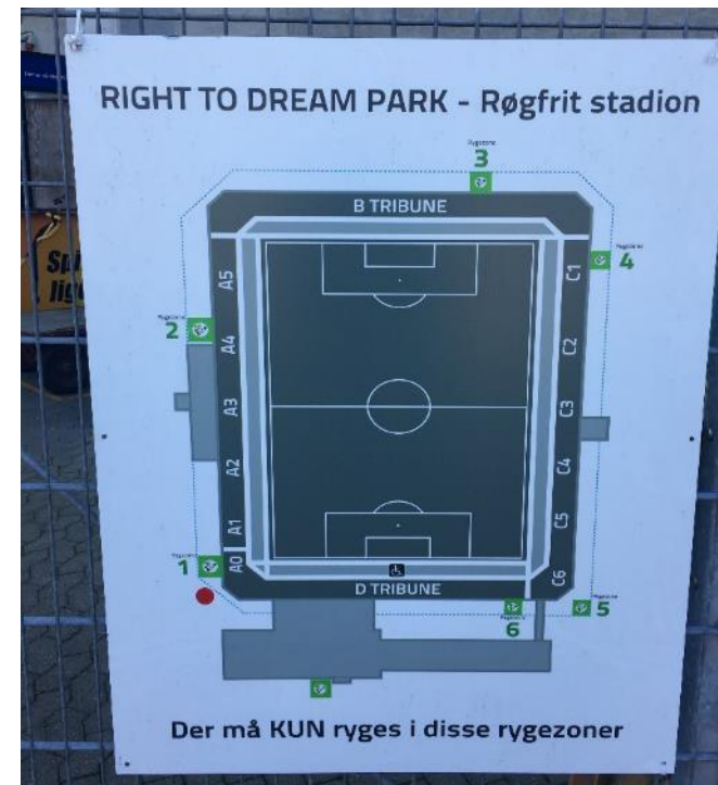
Skiltning ved indgangen til Farum stadion