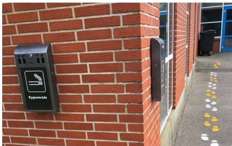
Skiltning i Skovlund-Ansager Hallen i Varde kommune