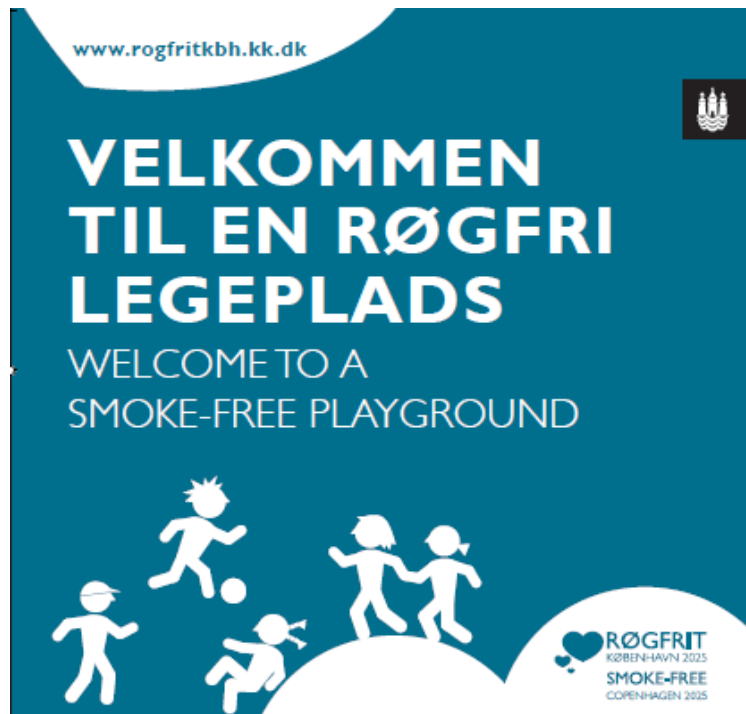
Skiltning ved legepladser i Københavns Kommune