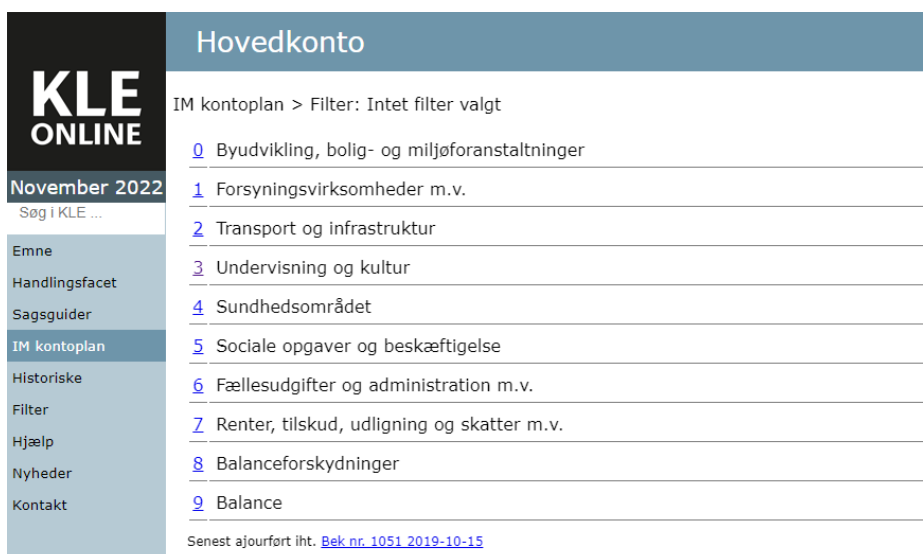
Figur 01 Hovedkonti i Indenrigsministeriets kontoplan