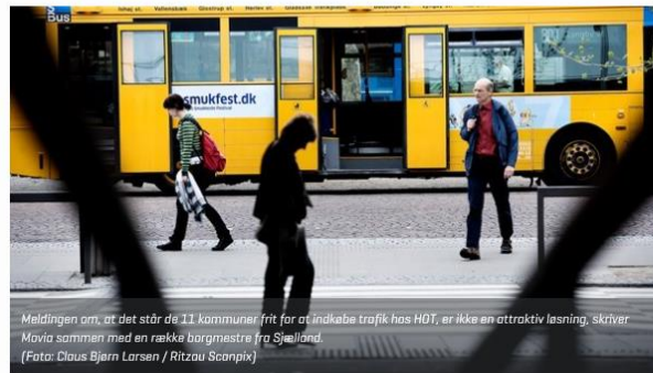
Meldingen om, at det står de 11 kommuner frit for at indkøbe trafik hos HDT, er ikke en attraktiv løsning, skriver Movia sammen med en række borgmestere fra Sjælland.

DEBAT: 56.000 mennesker pendler dagligt mellem de to dele af Sjælland, som regeringen med HDT vil skille ad. Det er ikke til at forstå, for Sjælland er ikke større end, at der bør findes fælles løsninger på udfordringer med mobilitet og pendling, skriver Movia sammen med en række sjællandske borgmestere.