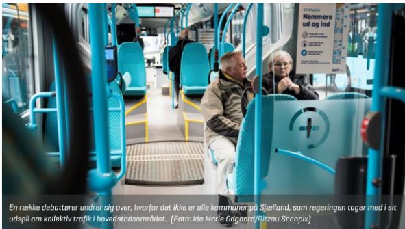
En række debatterer undrer sig over, hvorfor det ikke er alle kommuner på Sjælland, som regeringen tager med i sit udspil om kollektiv trafik i hovedstadsområdet.

DEBAT 5. februar 2019 kl. 1:00 | 0 kommentarer