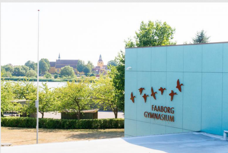
Faaborg Gymnasium er en af seks uddannelsesinstitutioner i Campus Faaborg-samarbejdet