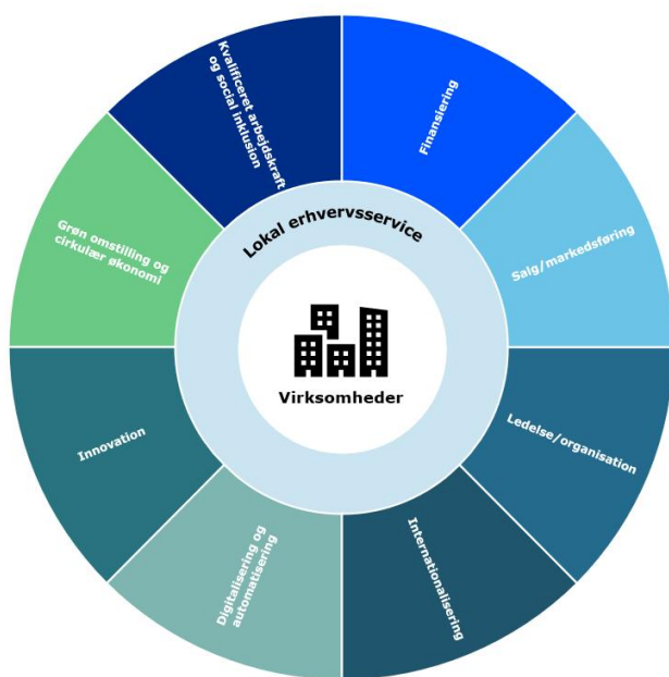
Figur: Nordjysk Erhvervsfremme Samarbejde

For at sikre samarbejdsaftalens implementering, og den løbende opfølgning for så vidt især angår afsnit 3 vedrørende den konkrete individuelle handlingsplan mellem Erhvervshus Nordjylland og det lokale erhvervskontor, udpeger Erhvervshus Nordjylland en kontaktperson, der varetager den generelle dialog med erhvervskontoret. Kontaktpersonen deltager sammen med en repræsentant fra Erhvervshus Nordjyllands ledelse i forbindelse med dialog med den lokale erhvervschef og medarbejdere om indgåelse af den individuelle handlingsplan (afsnit 3). For at styrke det generelle vidensniveau og samarbejdet mellem de lokale erhvervskontorer og Erhvervshus Nordjylland udarbejder Erhvervshus Nordjylland en tydelig oversigt over deres kontaktpersoner i forhold til hvert af de 11 erhvervskontorer (geografivinklen) og præcisering af hvilke af de 8 fagområder de enkelte forretningsudviklere i Erhvervshus Nordjylland varetager ansvaret for (fagvinklen). Derudover opdateres i den sammenhæng en oversigt over hvilke projekter og programmer, virksomhederne kan deltage i – med fokus på at udvikle sig på de enkelte fagområder (projekt- og programvinklen) – nedenstående figur er 1. udgave.