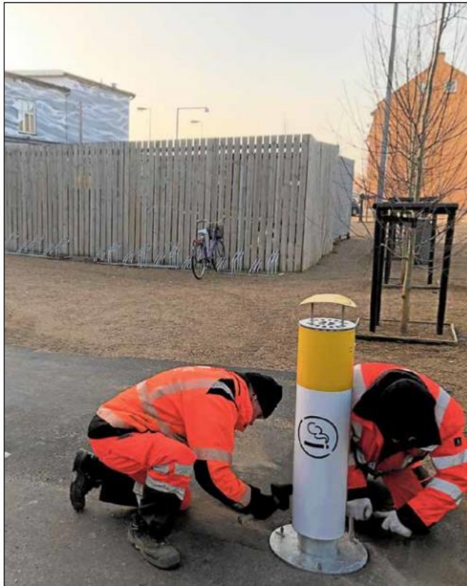
Det er folkene fra ETK, der har monteret de nye askebægre.

- I Køge Kommune arbejder vi hårdt for at gøre Køge til en ren og smuk oplevelse for borgerne. Vi håber, at de