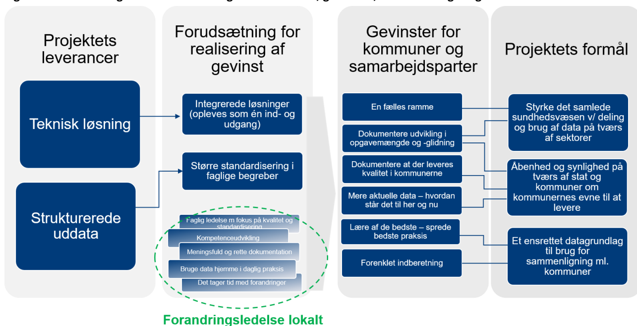
Figur 1.1: Gevinstdiagram - sammenhæng mellem formål, gevinster, forudsætninger og leverancer

Formålet med at stille FSIII data til rådighed til brug for statistik og ledelsesinformation (sekundært brug) i kommuner og Sundhedsdatastyrelsen, og på sigt Danmarks Statistik, RKKP m.fl. i form af en teknisk løsning er at: