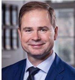
Nicolai Wammen (S) Finansminister