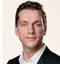
Kaare Dybvad Bek (S) Indenrigs- og Boligminister