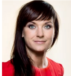
Sophie Løhde (V) Politisk ordfører for Venstre