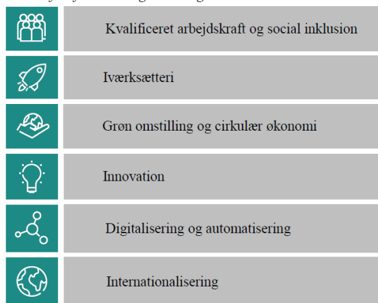
Drivkræfter for vækst og udvikling i hele landet

Den fælles nordjyske erhvervsfremmeindsats tager afsæt i de generelle drivkræfter for vækst og udvikling i hele Danmark. Disse går på tværs af virksomhedernes branche, type og størrelse, og byder på muligheder og udfordringer for virksomheder i hele landet.