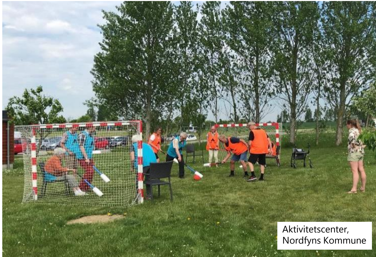
Aktivitetscenter, Nordfyns Kommune