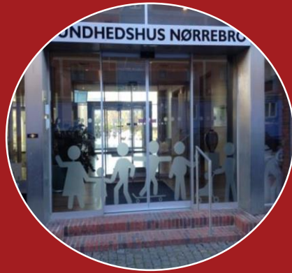
Traditionel rehabiliterings- træning