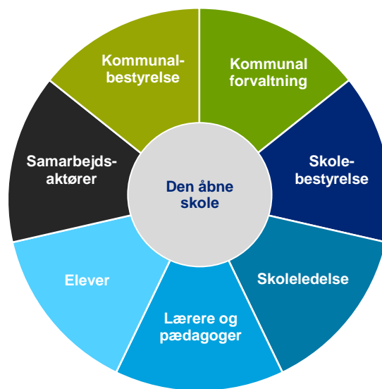
Figur 1. Aktører i den åbne skole

15 kommuner og 15 skoler indgår i erfaringsopsamlingen. Desuden indgår fem samarbejdsaktører. Kommunerne er udvalgt ud fra deskresearch af kommuner og skoler med erfaringer med samarbejder med forskellige aktører. Samarbejderne dækker de forskellige samarbejdsaktører, så hver samarbejdsaktør er repræsenteret med minimum to eksempler.