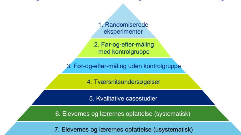
Figur 2. Evidensniveau for de gennemførte evalueringer

Der er dog undtagelser, hvor evaluering af samarbejderne er gennemført på et højere evidensniveau. For eksempel er der gennemført en evaluering af samarbejdsprojektet Haver til Maver i Fredensborg Kommune (samarbejde mellem virksomhed, landbrug og skole) af Institut for Uddannelse og Pædagogik. Her er der gennemført både en proces- og en outcomeevaluering. 3 I undersøgelsen er der dog ikke foretaget førmåling, hvilket placerer evalueringen i midten af evidenshierarkiet.