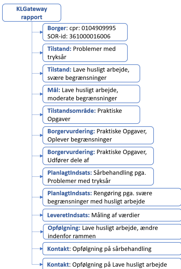
Figur 1 - Illustration af KLGateway rapport på overbliksniveau for eksemplet med borger Sverre.

Med udgangspunkt i eksemplet for borger Sverre vil en KLGateway rapport v.1 indeholde eksempler på alle modeller med tilhørende data som illustreret i figur 1.