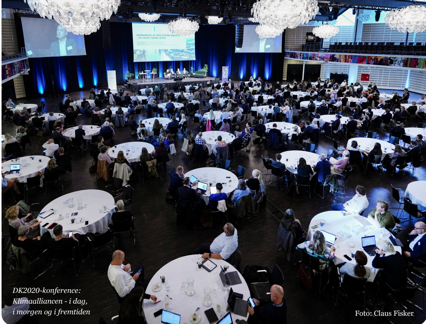
DK2020-konference: Klimaalliancen - i dag, i morgen og i fremtiden